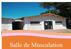
Salle de Musculation