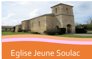
Eglise Jeune Soulac