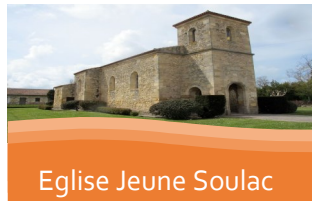
Eglise Jeune Soulac