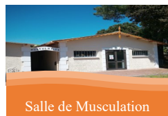
Salle de Musculation