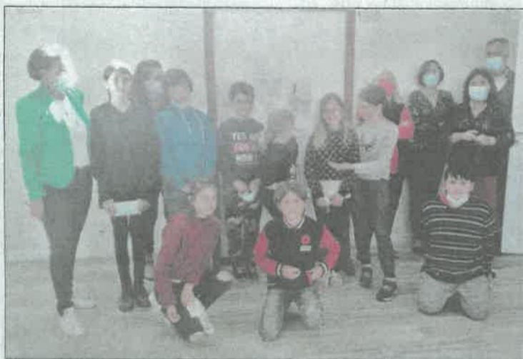
Les jeunes élus du CCJ à l'issue de la réunion de ce lundi.

Renseignements auprès de Muriel Dubourg au 05 56 73 29 02 / m.dubourg@mairie-soulac.fr